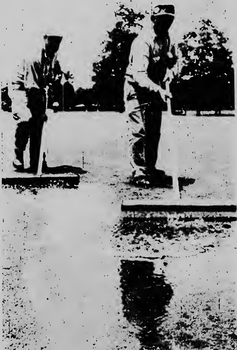
Aquí nos ta mira baridonan di caja ta haci tur nan esfuerzo aunke no cu mucho éxito pa lucha contra e inundación cu ta menaza Houston pa vía di jobidanen torencial di dos día largu. Hasta e segundo torneo di Houston Champion International mester a ser cancela pa motibu dje jobidanen.